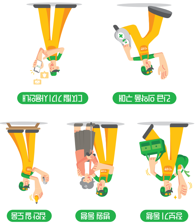
비행기 기내 서비스

이노비즈는 인공지능을 통해 이용할 수 있습니다. (리플렛 전면 및 앱 다운로드 및 설치방법 참조)