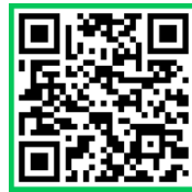
▲ 후후 앱 설치